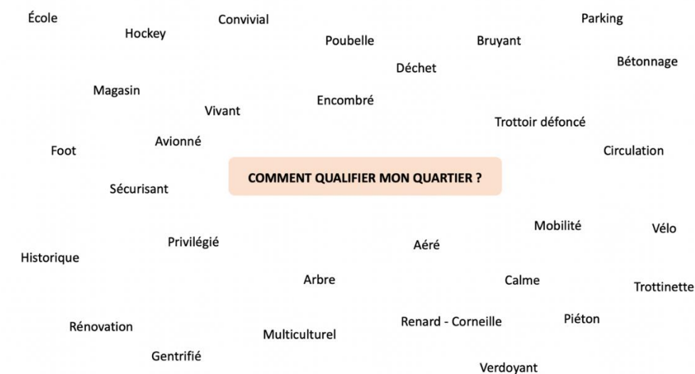
TABLEAU PARLANT (RETRANSCRIPTION)

PREMIÈRE ACTIVITÉ : ÉMERGENCE DES REPRÉSENTIONS DES HABITANTS SUR LEUR PERCEPTION DE LEUR QUARTIER